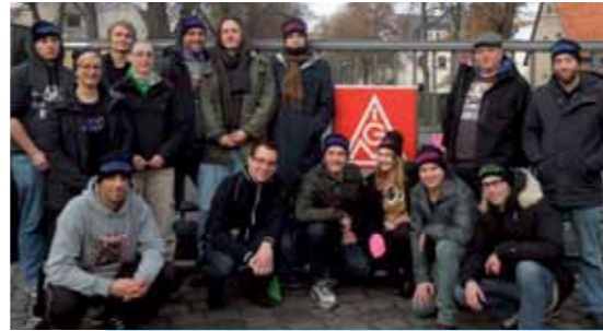
Die Studigruppe beim Klausurtreffen in Berlin Pichelsee.

Darüber hinaus finden auch Kooperationen mit anderen Hochschulgruppen statt. So wurde gemeinsam mit der Hamburger Gruppe „Blue Engineering“ im vergangenen Jahr der Film „Work Hard – Play