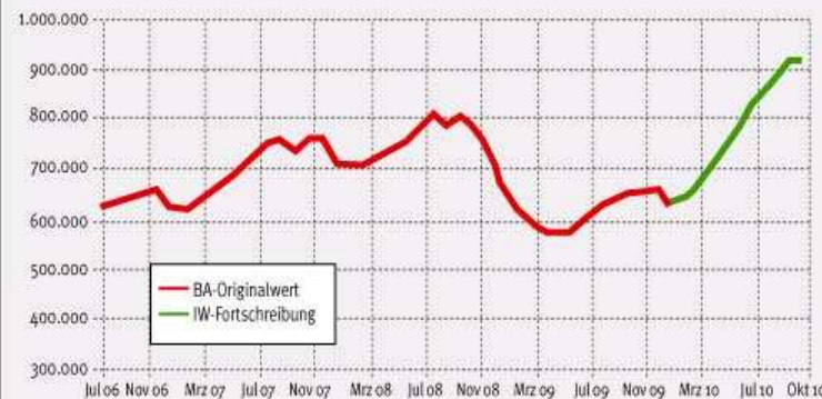
Entwicklung der Zahl der Leiharbeiter (absolut)